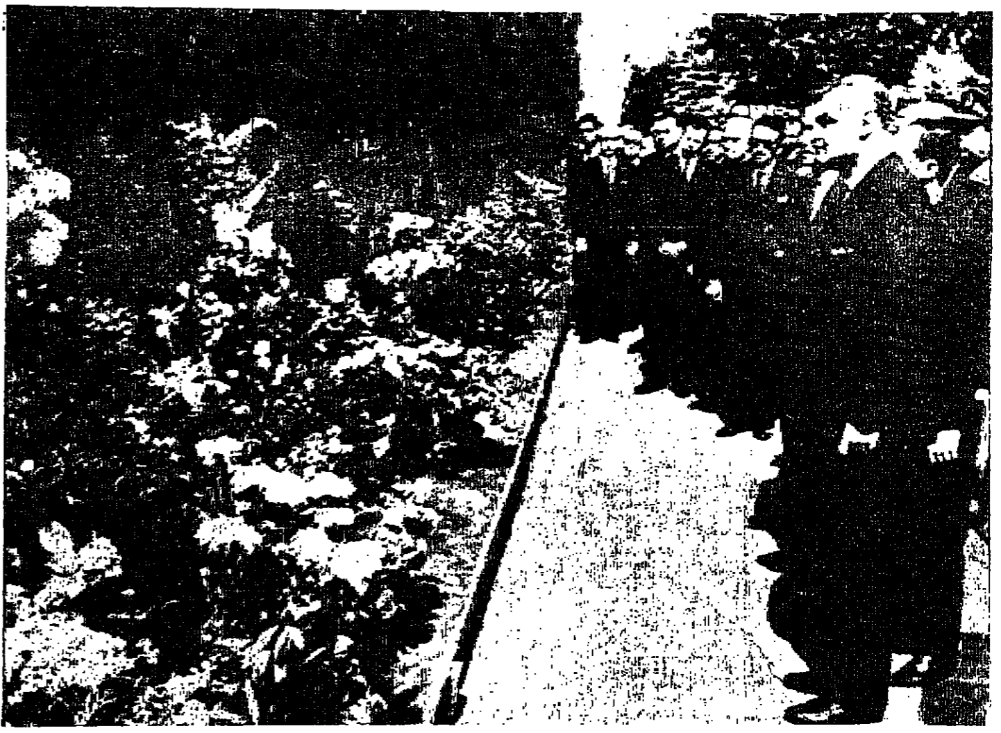
الرئيس جمال عبد الناصر لبيد زيارته فرجع رائد الفضاء السوفياتي بوري غاغارين في سور الكرملين

باد ايلنج «المانيا الغربية» - رويتر - انقذ رجل فتاة صغيرة من الغرق في بركة سباحة هنا دون ان يدرك ان ابنة الصغر يفرق على بعد بضعة أمتار عنها !